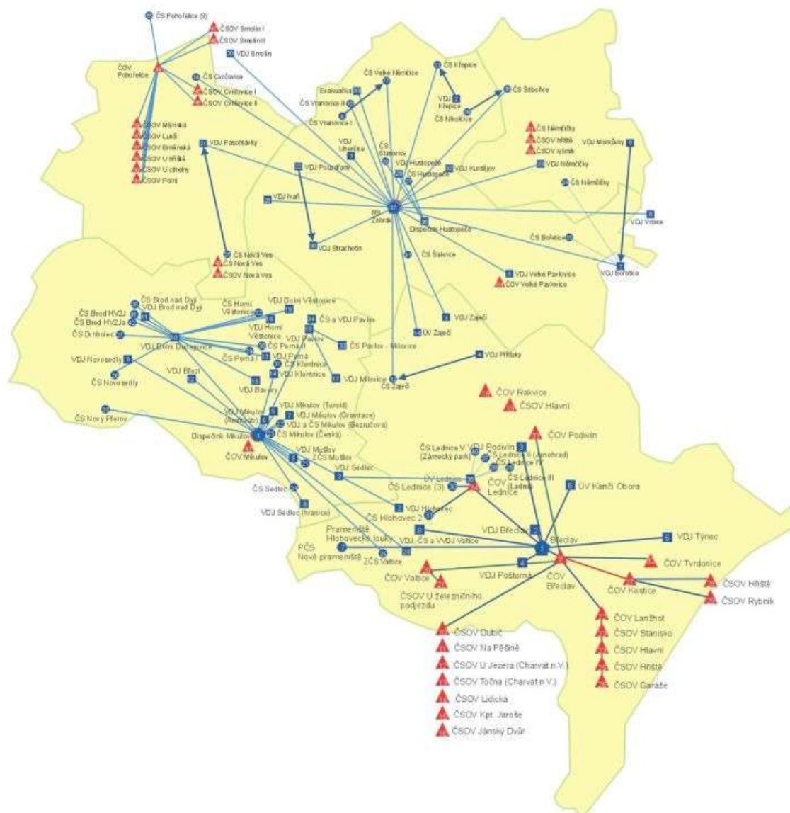
Obr. 1 – Schéma vodárenského a kanalizačního řídicího systému Břeclavsko

Z jednotlivých ČOV se na CKD budou přenášet jen vybrané informace. Toto řešení má několik výhod, které vedou k investičním i provozním úsporám a lze jej doporučit i dalším provozovatelům, kteří plánují realizaci obdobných akcí: